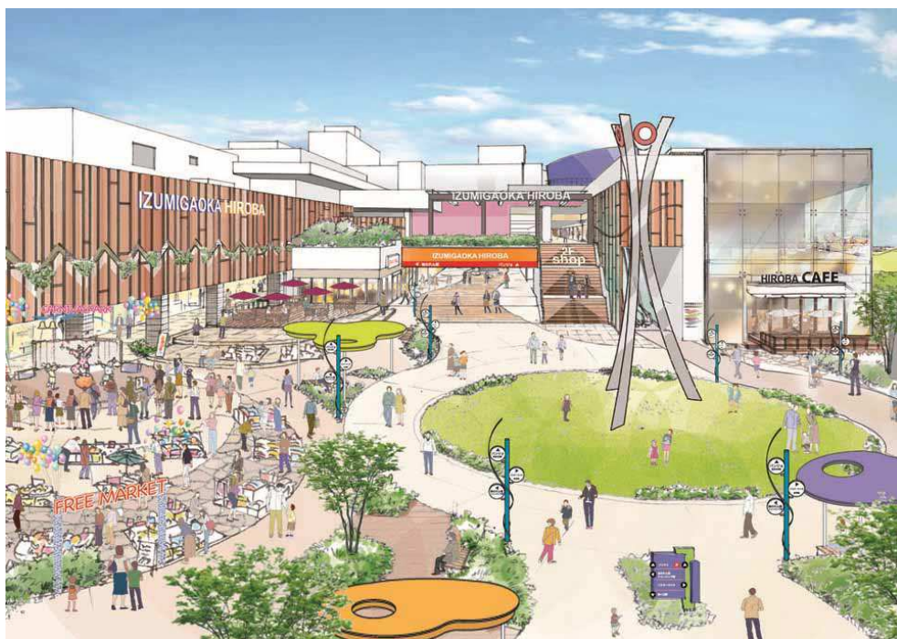
(駅前噴水広場＊再生後のイメージ図)